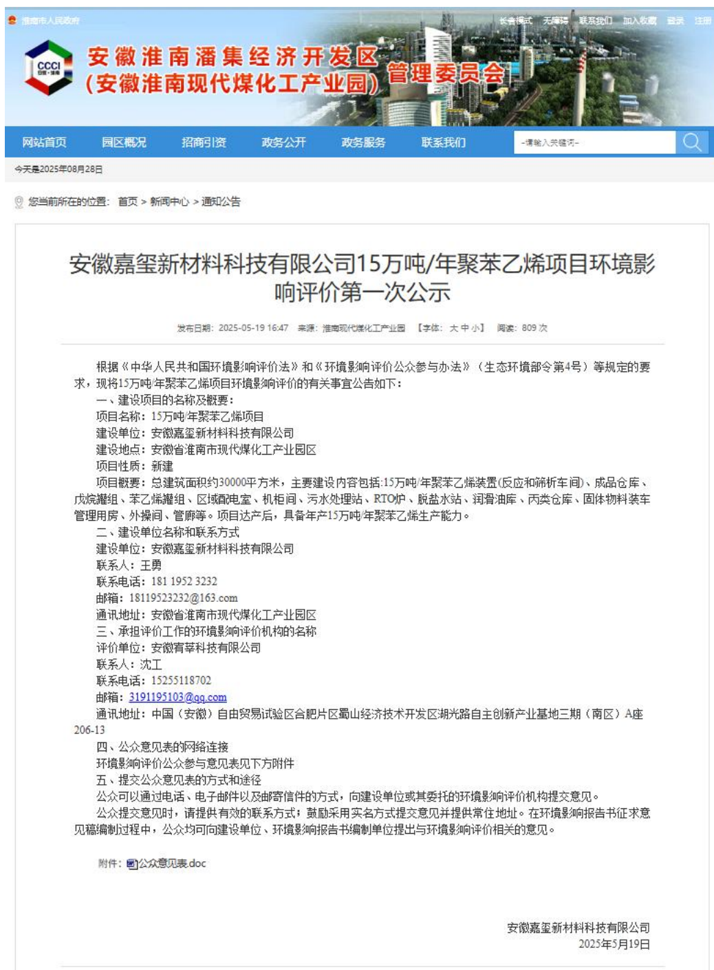
图 2.1 环境影响评价公众参与第一次公示