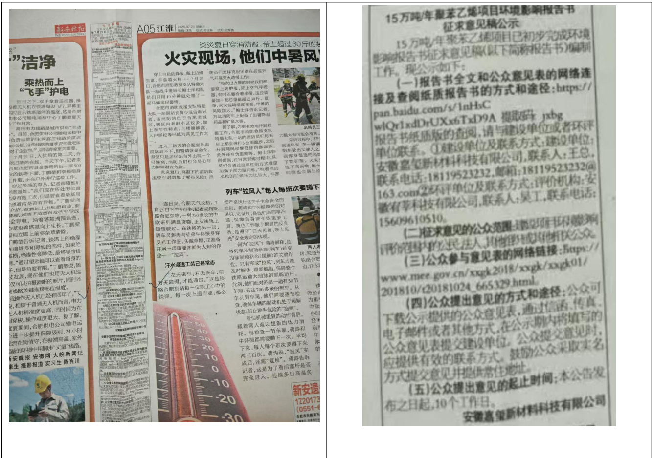
图 3.3 第二次报纸公示