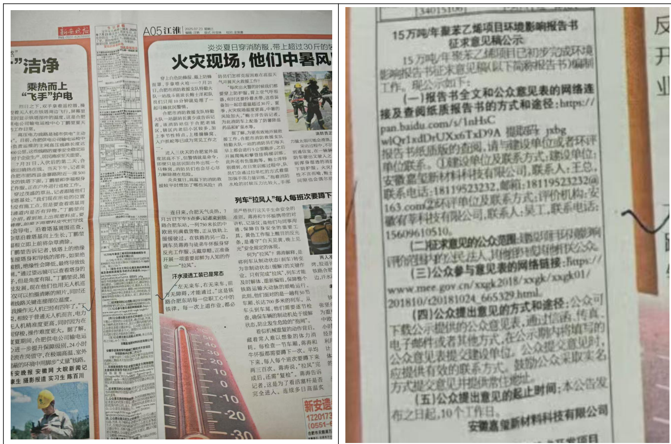
图 3.2 第一次报纸公示

根据《办法》第十一条第二款要求通过建设项目所在地公众易于接触的报纸公开，本次公示报纸选择江淮晨报，是建设项目所在地公众易于接触的报纸，符合要求。报纸分两次发布，第一次发布时间为2025年7月23日，第二次发布时间为2025年7月24日。具体公示情况如图3.2、3.3所示。