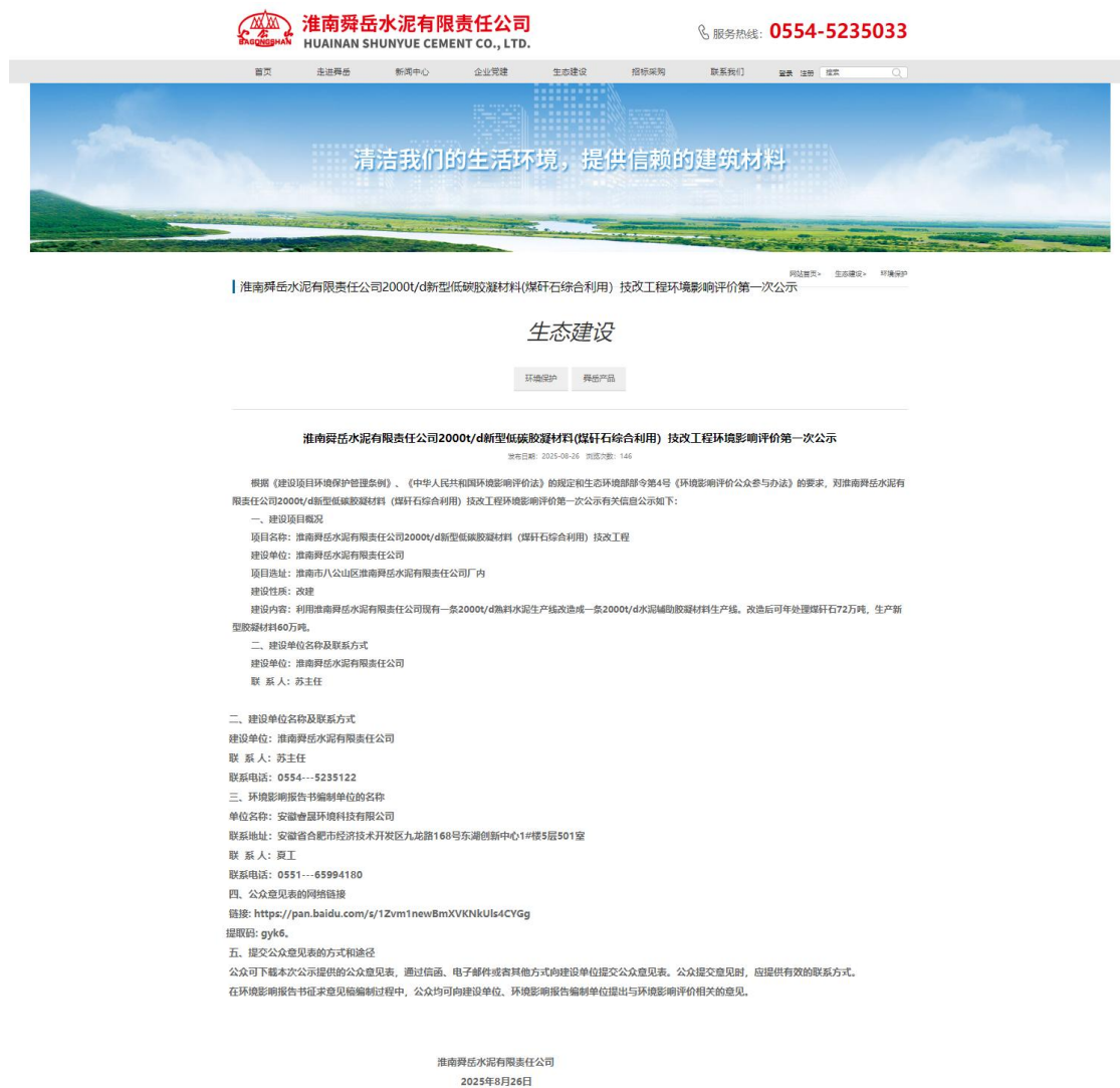
图 2-1 2025 年 8 月 26 日第一次网络公示截图