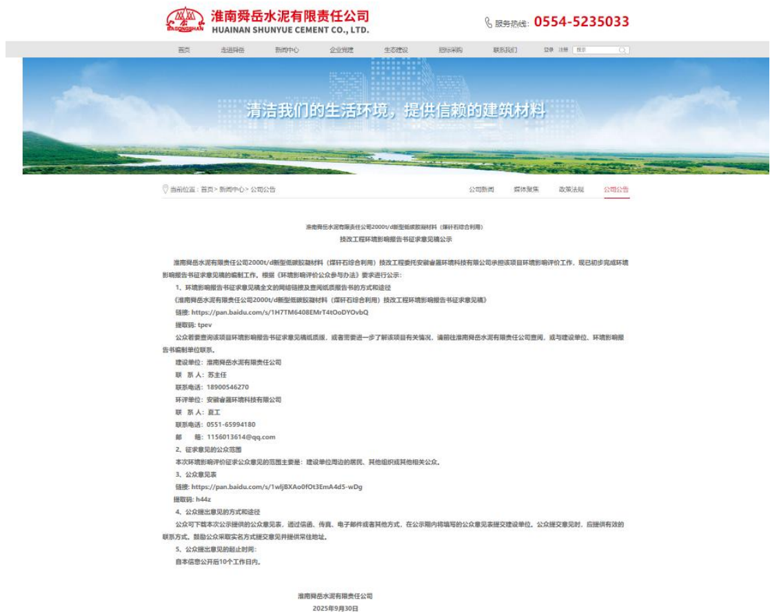
图 3-1 2025 年 9 月 30 日第二次网络公示截图