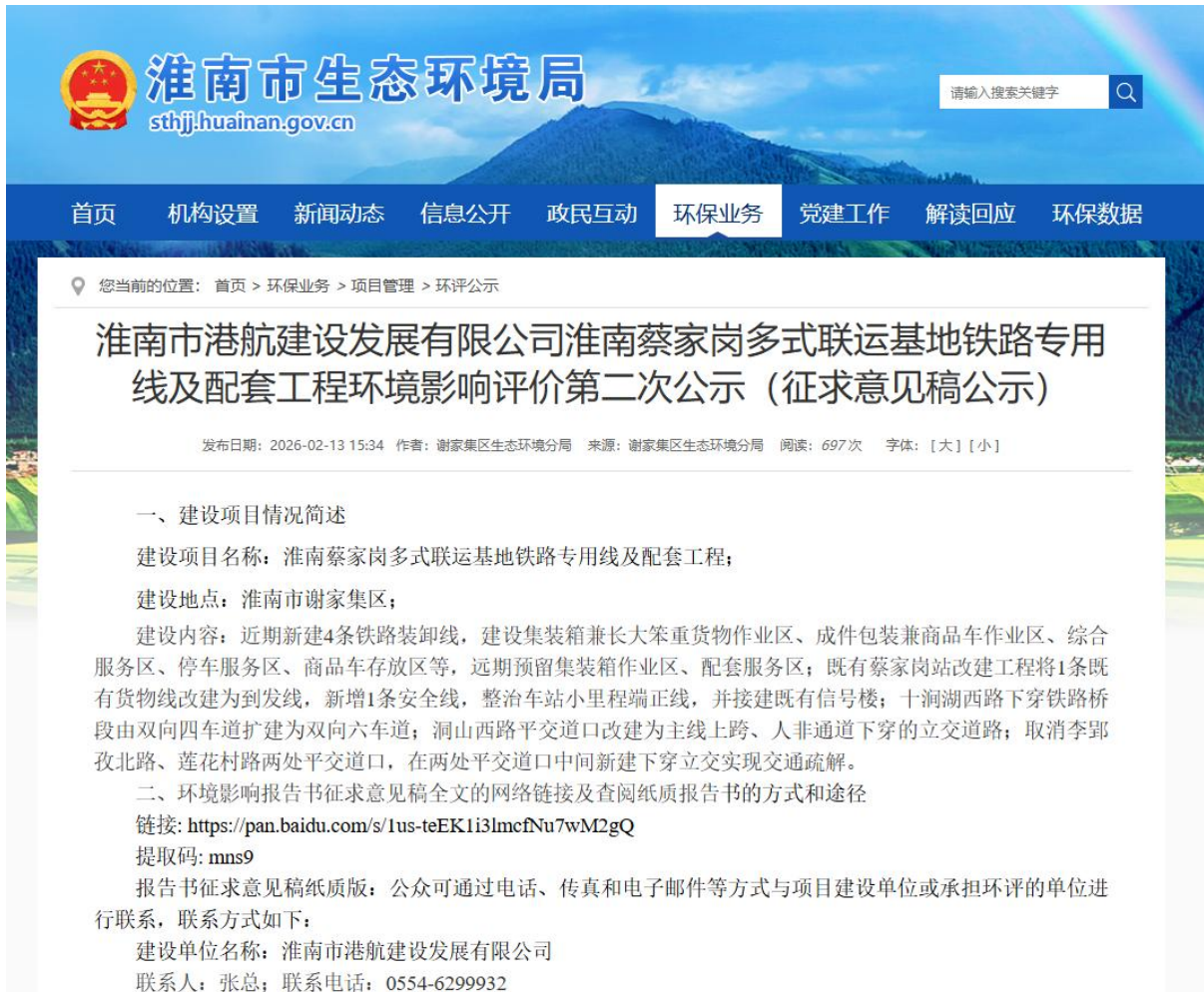
图 3-1 征求意见稿信息公开情况公示截图