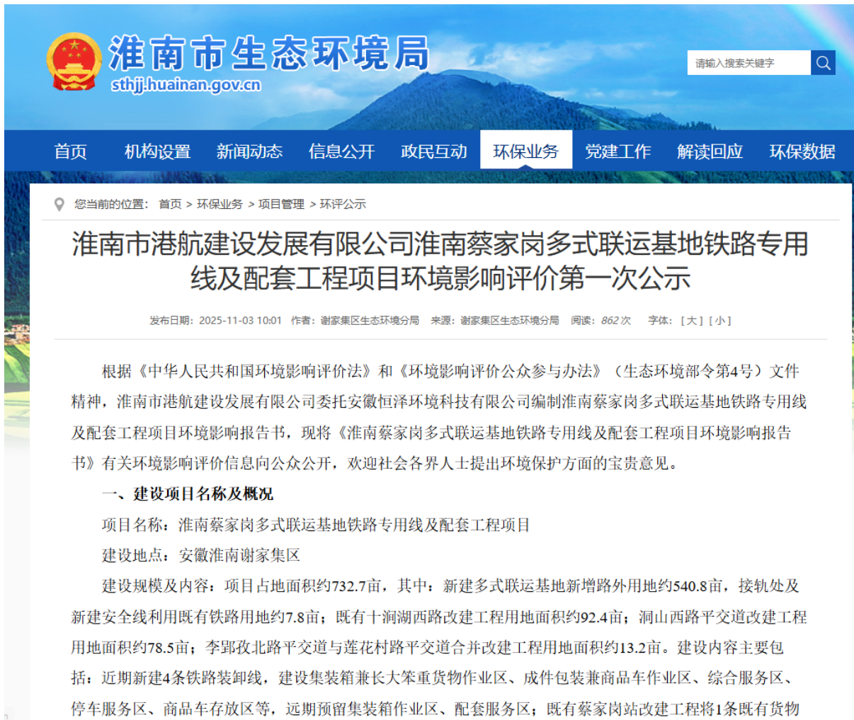
图 2-1 首次环境影响评价信息公开情况公示截图