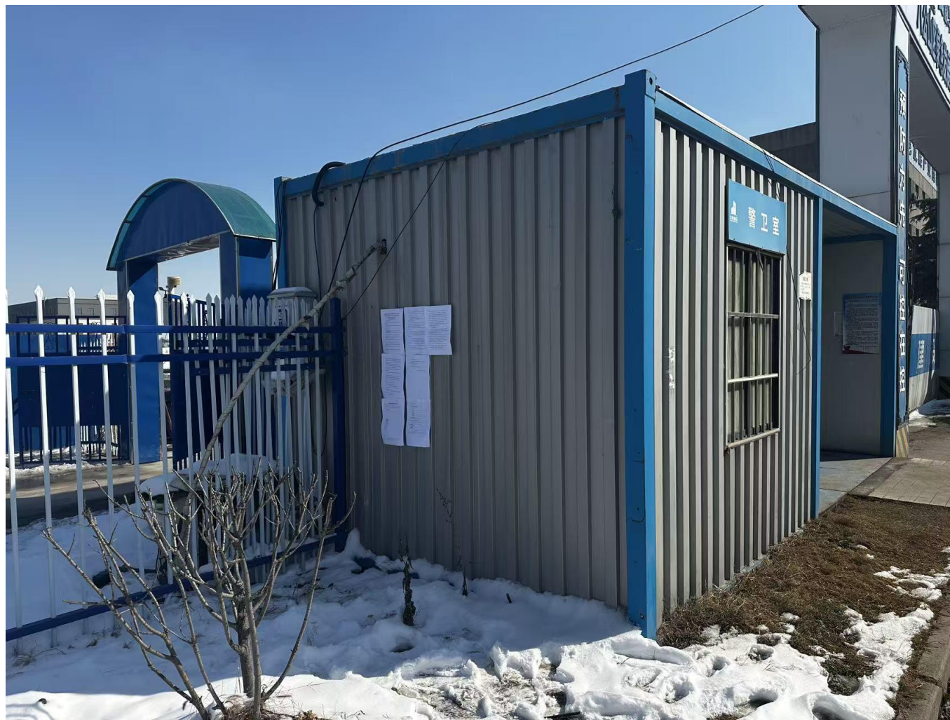
图 3-5 公示情况张贴公告照片