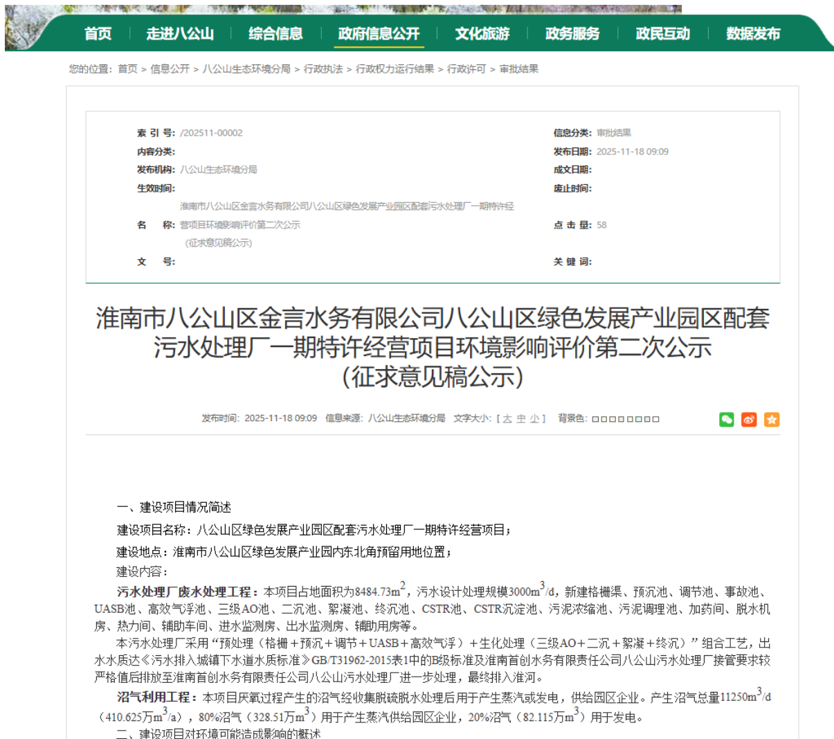
图 3-1 征求意见稿信息公开情况公示截图