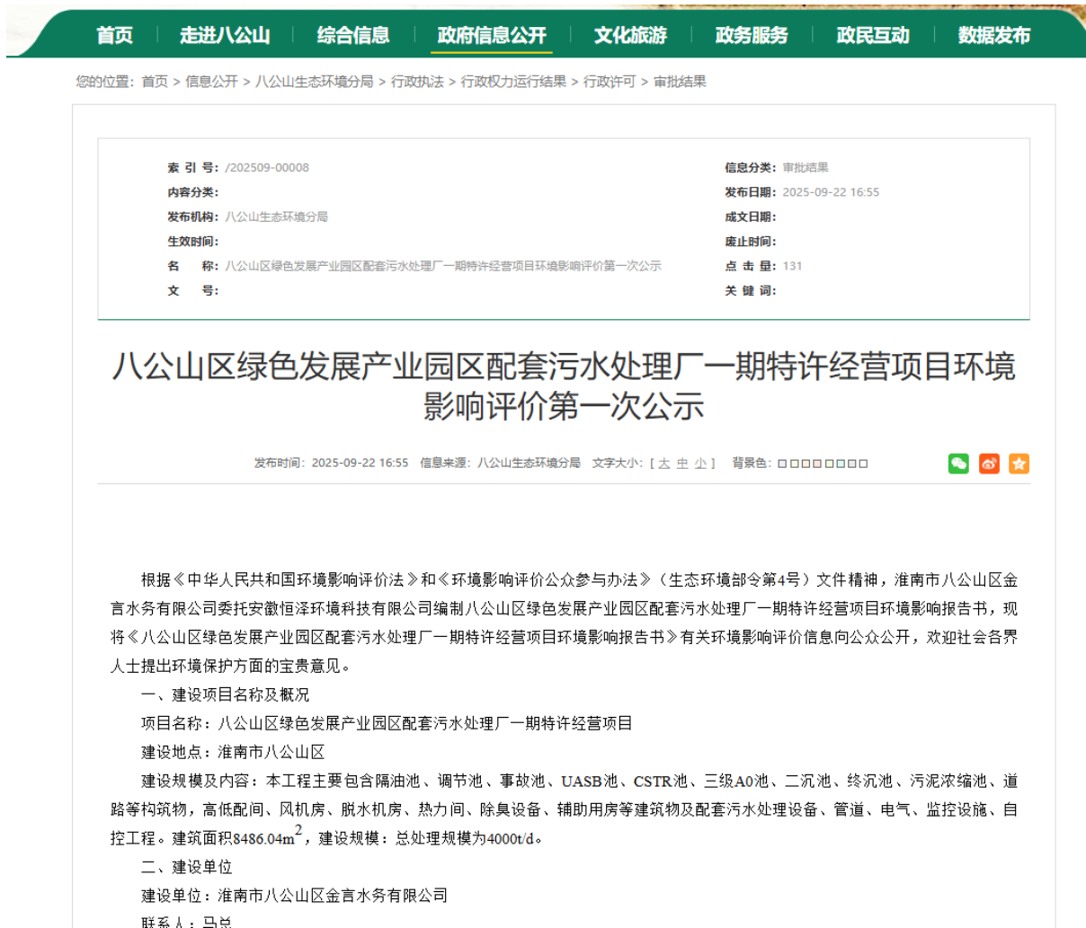
图 2-1 首次环境影响评价信息公开情况公示截图