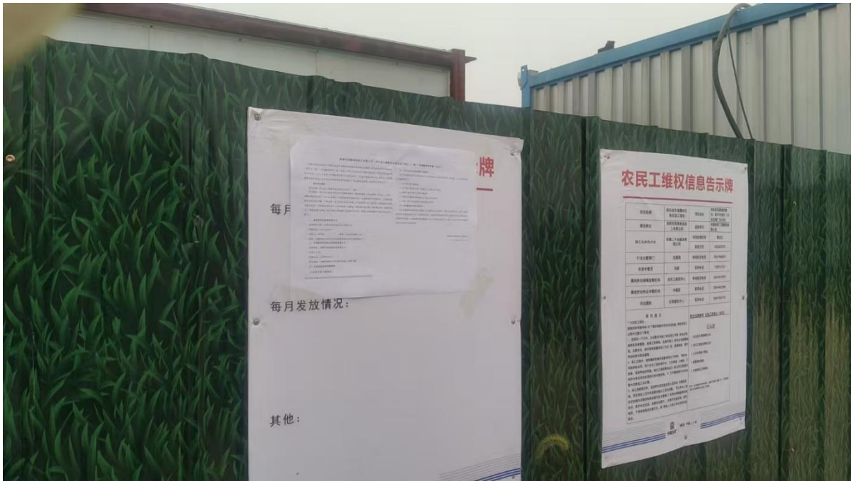
图 2-2 首次环境影响评价信息公开项目所在地公示截图