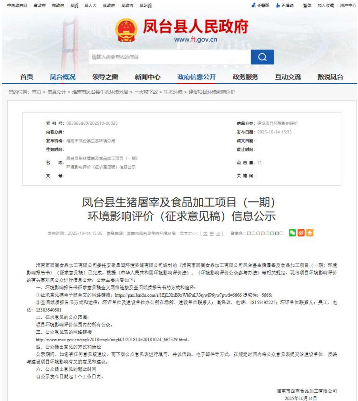
图 3-1 第二次环境影响评价信息公开情况公示截图