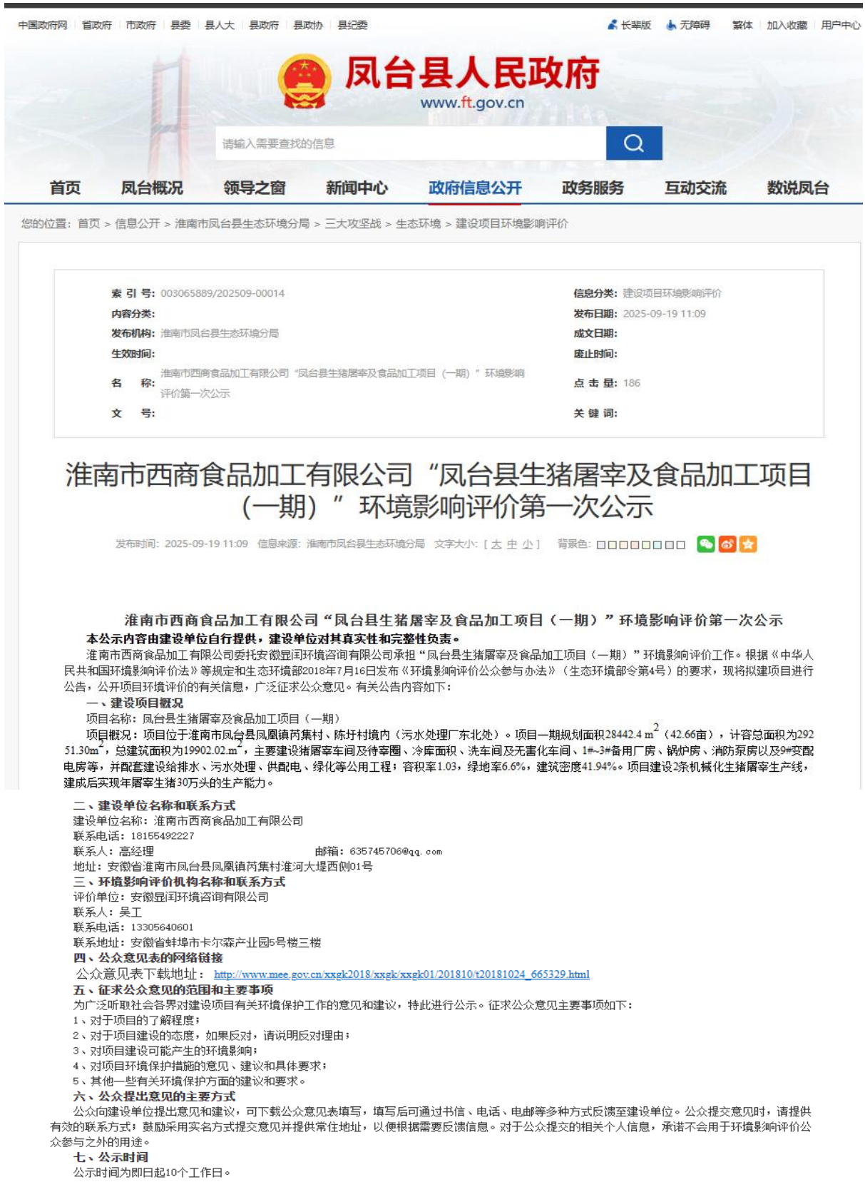
图 2-1 首次环境影响评价信息公开情况公示截图