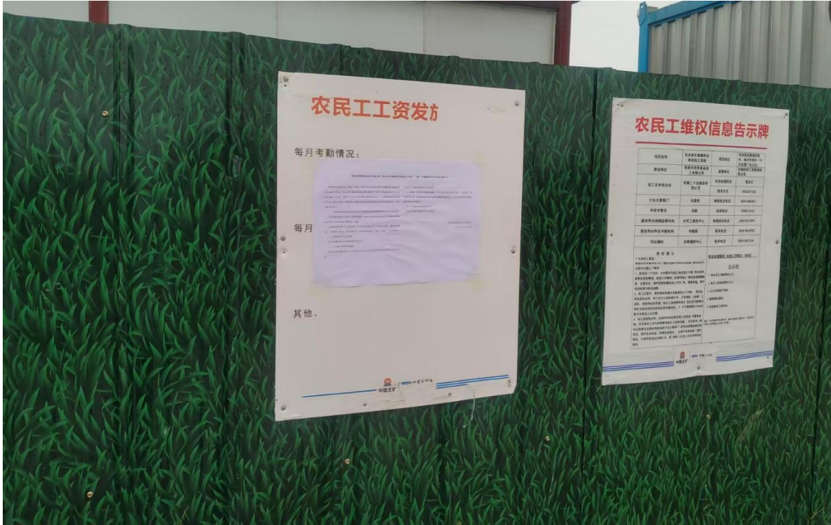
图 3-4 征求意见稿现场公示