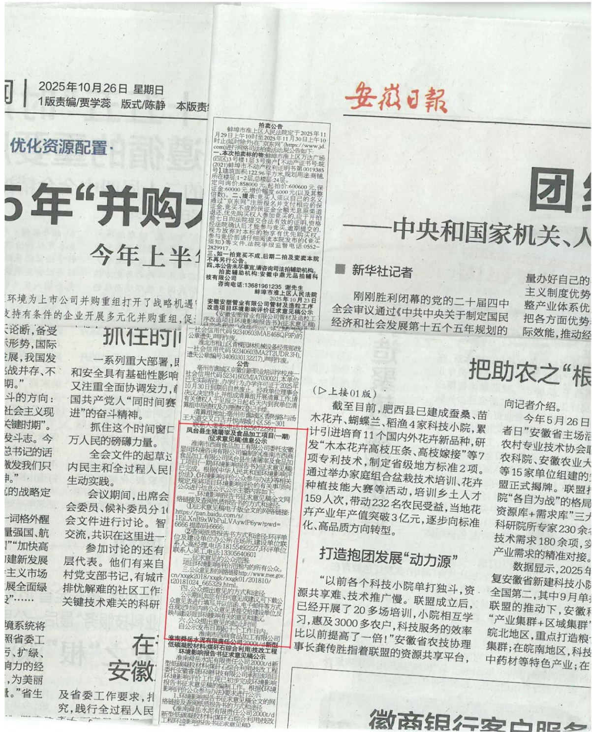
图 3-3 报纸公示（2）