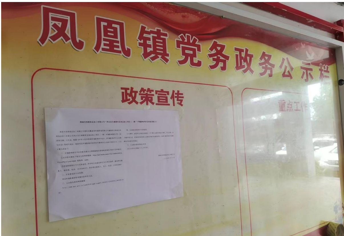
图 3-4 征求意见稿凤凰镇政府现场公示